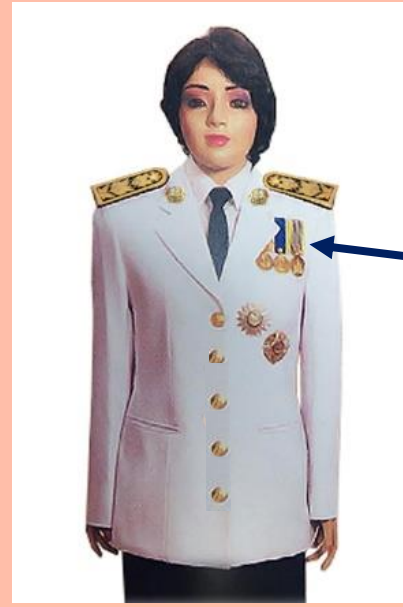
เครื่องแบบครึ่งยศ

ประดับดารา ดวงตรา และสวมสายสะพายเช่นเดิม เหรียญราชอิสริยาภรณ์ เช่นเหรียญที่พระราชทาน เป็นที่ระลึกในโอกาสต่าง ๆ ให้ประดับโดยใช้แพรแถบ แบบบุรุษ