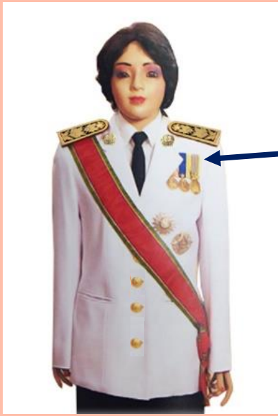
เครื่องแบบเต็มยศ

ประดับดารา ดวงตรา และสวมสายสะพายเช่นเดิม เหรียญราชอิสริยาภรณ์ เช่นเหรียญที่พระราชทาน เป็นที่ระลึกในโอกาสต่าง ๆ ให้ประดับโดยใช้แพรแถบ แบบบุรุษ