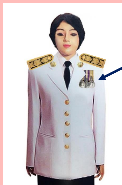
เครื่องแบบเต็มยศและครึ่งยศ

ประดับแพรแถบ เหรียญที่พระราชทานเป็นที่ระลึก ในโอกาสต่าง ๆ แบบบุรุษ ที่อกเสื้อเบื้องซ้าย